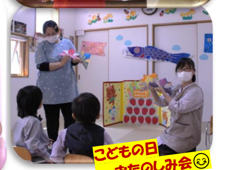
こどもの日 おたのしみ会😊