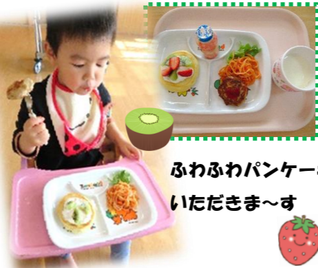
ふわふわパンケーキ いただきま〜す