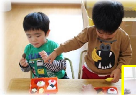
うまくお弁当できたよ～