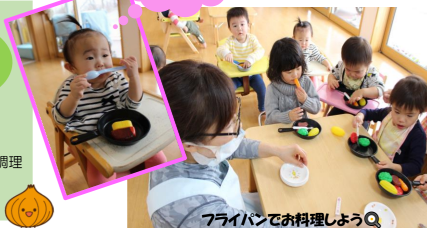
フライパンでお料理しようQ